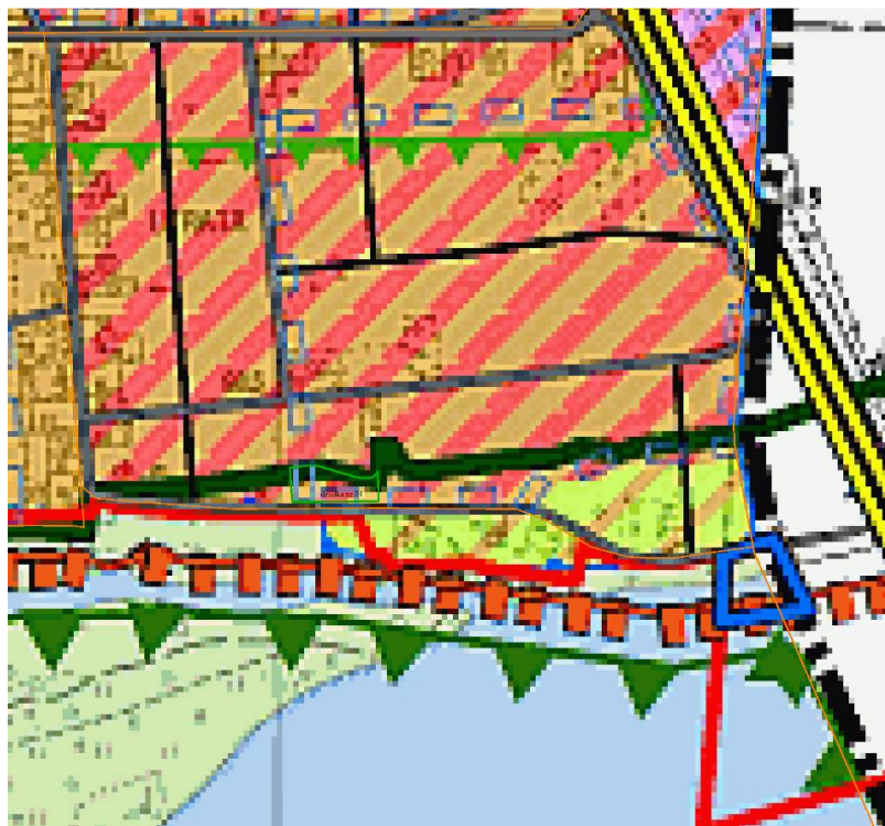
Rysunek 2 Wyrys ze studium.

Rysunek 1 Wyrys z poprzednio obowiązującego miejscowego planu zagospodarowania przestrzennego miasta Zakroczym z roku 2007.